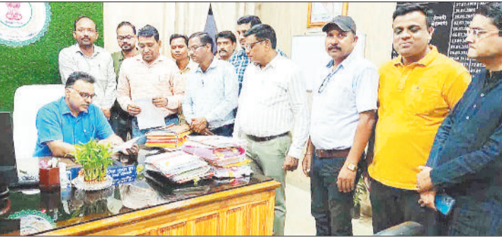
ज्ञापन सौंपते एसोसिएशन के सदस्य।